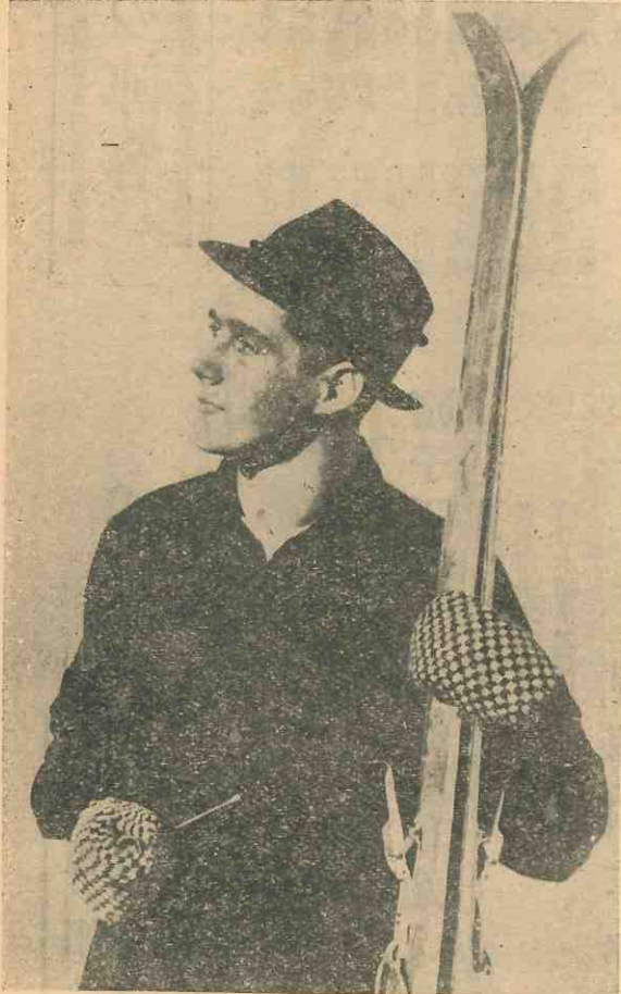
ピングクロスビーはテロル帽の販賣に一役買うだろう